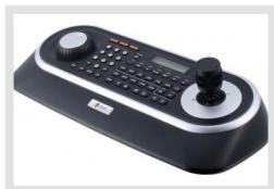
KBD-2USB | Réf.: 217652