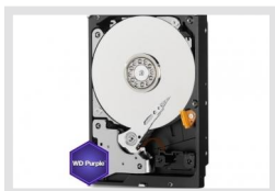
HDD-3000SATA Purple | Réf.: 217657