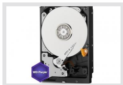
HDD-2000SATA Purple | Réf.: 217658